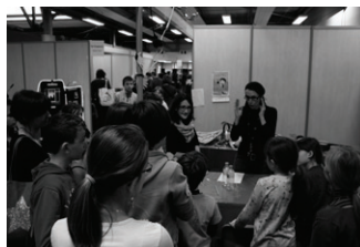
Mise en scène